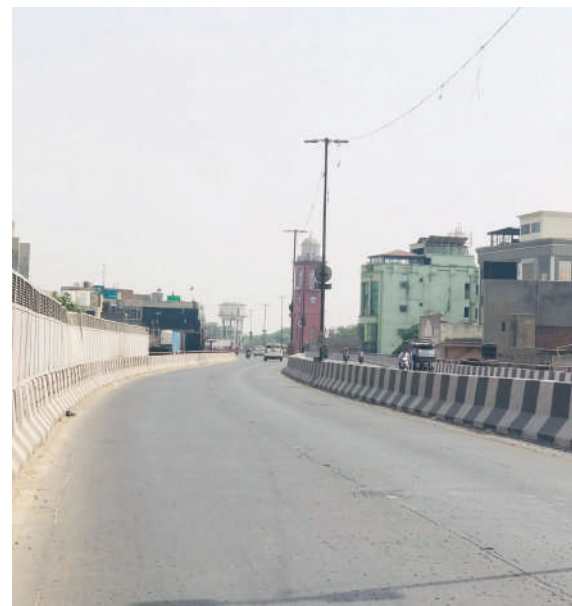
गौसमी-कपूर...शुक्रवार को भीषण गर्मी के दौरान घंटाघर प्लाइओवर पर दोपहर के वक़्त सज्जाटा पसरा रहा।